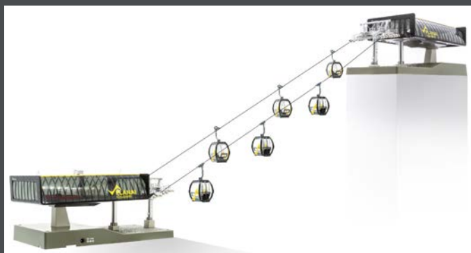
JC82499 D-LINE SET PLANAI, 1 X TALSTATION MIT BELEUCHTUNG UND ANTRIEB 1 X BERGSTATION MIT BELEUCHTUNG 6 X OMEGA V10 „PLANAI“ (5 X SCHWARZ, 1 X GELB) 1 X STRECKENKABEL 3 M 1 X SEIL 10 M