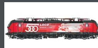
LS17912 E-LOK RH 1293 018 VECTRON ÖBB, EP.VI, 500TH, AC LS17912S MIT SOUND