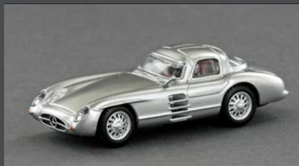
LE87300 MB 300 SLR UHLENHAUT COUPÉ, W 196 S, SILBER MIT ROTER INNENAUS- STATTUNG, 1:87