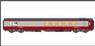
LS40158 SPEISEWAGEN VRU "GRIL EXPRESS" SNCF, EP.IV, PROTOTYP, ROT/GR