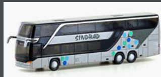
LC4486 SETRA S 431 DT SINDBAD (PL), METALLIC