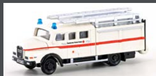
LC4223 MAN LF 16-TS GERÄTEWAGEN DRK