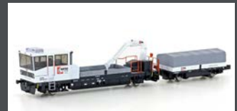
H23566 GLEISKRAFTWAGEN ROBEL TM234 SERSA, EP. VI, MOTORISIERT