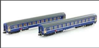
K23010 2ER SET RIC LIEGE- WAGEN BCM SBB, EP.IV-V