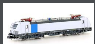
H30156 E-LOK BR 193 813 VEC- TRON RAILPOOL, EP.VI