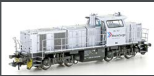
90236 DIESELLOK VOSSLÖH G1000 BB RHEINCARGO, EP.VI