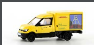
LC4553 STREETSCOOTER WORK "DHL RUHRGEBIET" 1:160