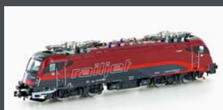
H2733 E-LOK RH 1216 TAURUS ÖBB RAILJET, EP.VI