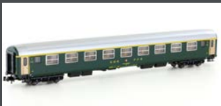
K23119 SBB RIC WAGEN ALTES LOGO 1. KL. AM