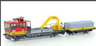
H23567 GLEISKRAFTWAGEN ROBEL X552 ÖBB, EP.V-VI, MOTORISIERT