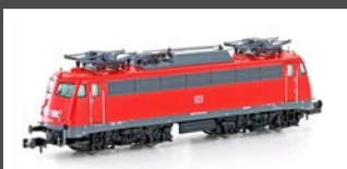
H28013 E-LOK BR 113 DB AG EP.V-VI, VERKEHRSROT H28013S MIT SOUND