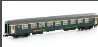
K23120 SBB RIC WAGEN NEUES LOGO 1. KL. AM