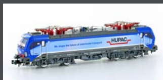
H3003 E-LOK BR 193 VECTRON HUPAC, EP.VI