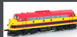
HE10044564 NOHAB MY 1151 EIVEL "KANSAS CITY" EP.VI GELB/ROT, AC SOUND