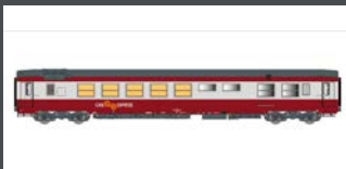
LS40154 SPEISEWAGEN "GRIL EXPRESS" SNCF, EP.IV, ROT/GRAU