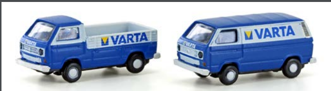
LC4345 VVV T3 2ER SET VARTA