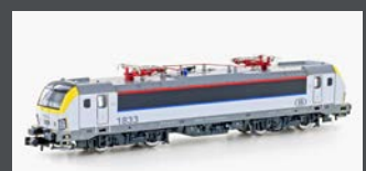
H30163 E-LOK HLE 18 SNCF, EP.VI