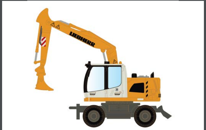
LC4266 LIEBHERR COMPACT BAGGER MIT TIEFLÖFFEL