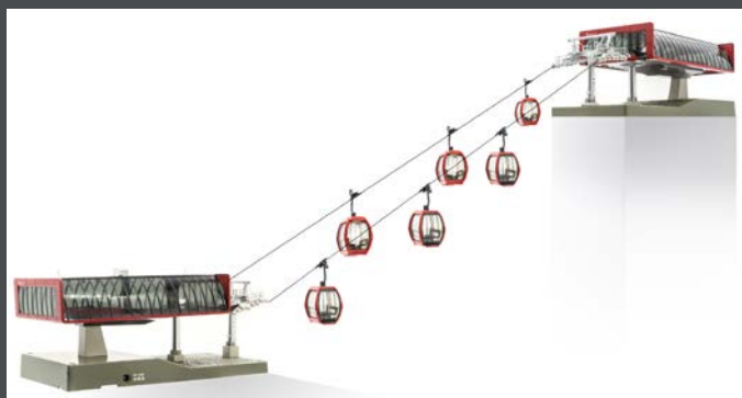
JC82496 D-LINE SET ROT/SCHWARZ, 1 X TALSTATION MIT BELEUCHTUNG UND ANTRIEB 1 X BERGSTATION MIT BELEUCHTUNG 6 X OMEGA V10 „ROT“ 1 X STRECKENKABEL 3 M 1 X SEIL 10 M