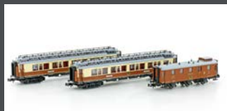
H22102 3-TLG. CIWL SET 1 SIMPLON-EXPRESS EP.I