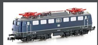
H28121 E-LOK BR 110.1 DB, EP.IV, BLAU / SCHWARZ H28112S MIT SOUND