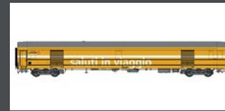
LS47283 POSTWAGEN TYP Z SBB, EP.VI, GELB/WEISS "SALUTI IN VIAGGIO"