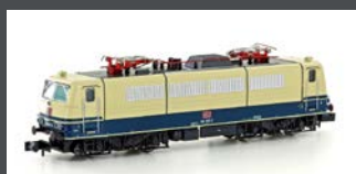
H2885 E-LOK BR 184 003-2 DB MUSEUMLOK, EP.V, BLAU/BEIGE