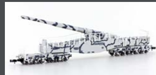
H23603 LEOPOLD EISENBAHN- GESCHÜTZ K5, EPOCHE II, IN WINTER-TARNLACKIERUNG