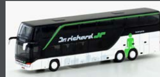
LC4481 SETRA S 431 DT DR. RICHARD (AT)