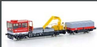
H23568 GLEISKRAFTWAGEN ROBEL TM234 SOB, EP.V-VI, MOTORISIERT