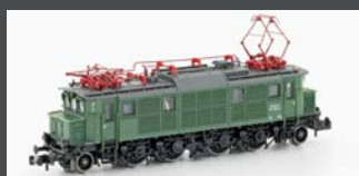
H2894 E-LOK BR E117 122-2 DB GRÜN EP.IV