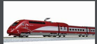
K101658 TRIEBZUG TGV T HALYS PBKA, 10-TLG., EP.VI, NEUES DESIGN