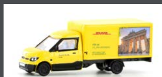
LC4560 STREETSCOOTER WORK-L "DHL BERLIN" 1:160