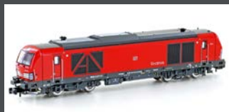
H3111 DIESELLOK BR 247 902 DB CARGO, EP.VI