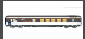
LS40157 SPEISEWAGEN "GRIL EXPRESS" SNCF, EP.IV-V, CORAIL, GRAU/WEISS