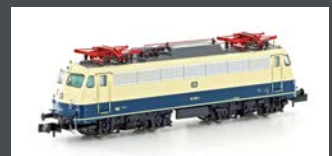
H28012 E-LOK BR 110.3 DB EP. IV, OZEANBLAU / BEIGE H28012S MIT SOUND