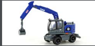
LC4261 LIEBHERR COMPACT BAGGER THW M. GREIFER