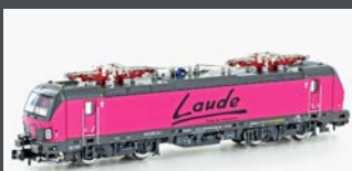
H30157 E-LOK BR 193 VECTRON LAUDE, EP.VI H30157S MIT SOUND