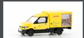
LC4555 STREETSCOOTER WORK "DHL HAMBURG" 1:160