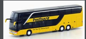
LC4482 SETRA S 431DT POST- BUS