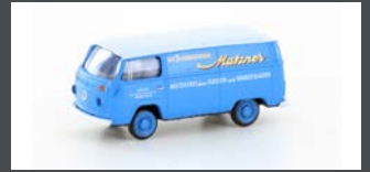
LC3920 VW T2 TRANSPORTER "MATZNER FEINKOST"