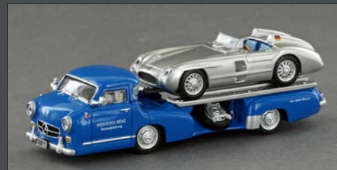
LE87310 MERCEDES BENZ RENNTRANSPOR- TER, „DAS BLAUE WUNDER“ BELADEN MIT EINEM MERCEDES BENZ 300 SLR ROADSTER, 1:87