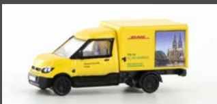
LC4552 STREETSCOOTER WORK "DHL KÖLN" 1:160