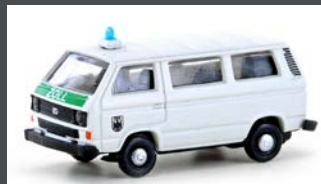
LC4352 VW T3 BUS ZOLL