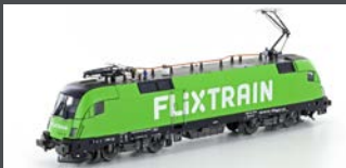
JC18182 E-LOK BR182.505 TAURUS FLIXTRAIN, EP.VI, AC SOUND JC28182 DC SOUND