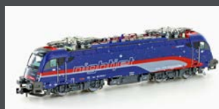
H27375 E-LOK RH 1216 012 TAURUS ÖBB NIGHTJET, EP.VI, SOUND