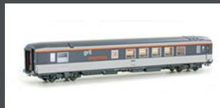
LS40156.1 SPEISEWAGEN "GRIL EXPRESS" SNCF, EP.IV-V, CORAIL, GRAU/WEISS