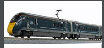
K101671 TRIEBZUG CLASS 800/0 GWR, 5-TLG., EP.VI