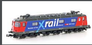
K10176 E-LOK RE 620 SBB CARGO / XRAIL, EP.V-VI, MIT KLIMAAANLAGE