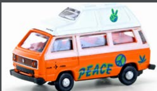
LC4351 VW T3 WESTFALIA CAMPER "GRAFFITI"