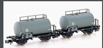
H24801 2ER SET LEICHTBAU- KESSELWAGEN DB/EVA, EP.III