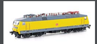
LS16086 BR120 DB EP.V DBAG LOGO GELB/GRAU