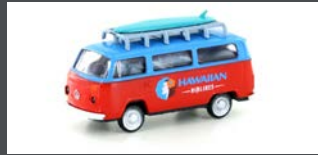
LC3923 VW T2 BUS "SURFING"