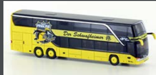
LC4477 SETRA S 431 DT KEV MANNSCHAFTSBUS