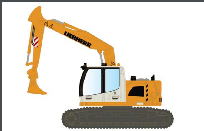
LC4267 LIEBHERR COMPACT KETTENBAGGER MIT BÖSCHUNGSSCHAUFEL