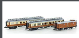
H22103 3-TLG. CIWL SET 2 SIMPLON-EXPRESS EP.I