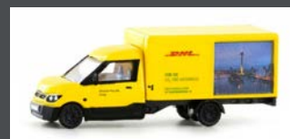
LC4561 STREETSCOOTER WORK-L "DHL DÜSSELDORF" 1:160