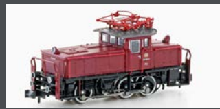
H3052 E-LOK BR 163 DB, EP.IV, ROT/SCHWARZ