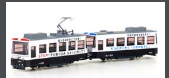
K14503-3 KATO POCKET LINE STRASSENBAHN 2TLG. P ATROL TRAM