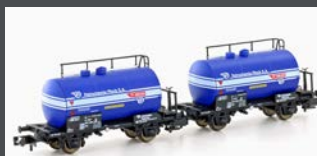
H24851 2ER SET LEICHTBAU- KESSELWAGEN PKP/PETRO- CHEMIA, EP.IV/V