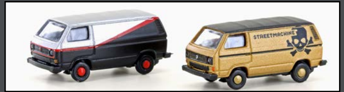
LC4344 VW T3 2ER SET TUNING (METALLIC SERIE)