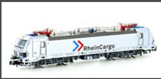
H30165 E-LOK BR 192 SMARTRON RHC, EP.VI