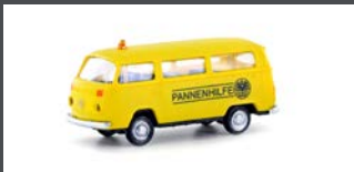
LC3925 VW T2 BUS ÖAMTC PANNENHILFE