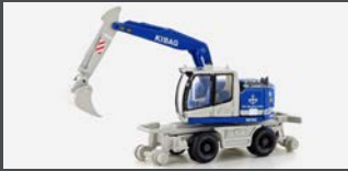
LC4259 LIEBHERR A922 RAIL 2-WEGE BAGGER KIBAG (CH) M. TIEFLÖFFEL