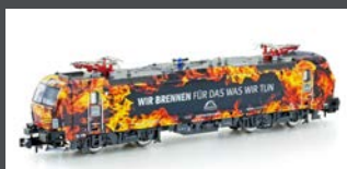
H30151 E-LOK BR 1923 878 VEC- TRON TXL "WIR BRENNEN", EP.VI H30151S MIT SOUND