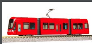
K14805-2 MODERNER STRASSENBAHN- GELENKTRIEBWAGEN, EP.V-VI, ROT