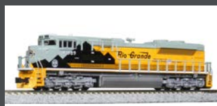
K1768405 DIESELLOK EMD SD70ACE UP/D&RGW HERITA- GE EP.6