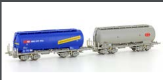
H23483 2TLG. SILOWAGEN UACS SBB BLAU / GRAU EP.VI