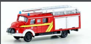
LC4204 MB LF 16 TS FEUER- WEHR LOTTE / OSNABRÜCK