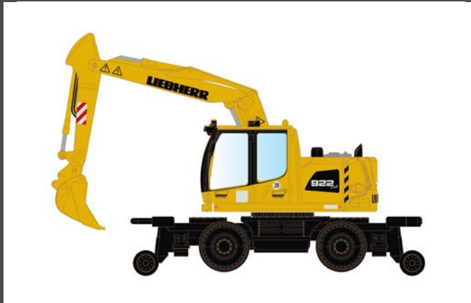
LC4265 LIEBHERR A922 RAIL 2-WEGE BAGGER MIT TIEFLÖFFEL