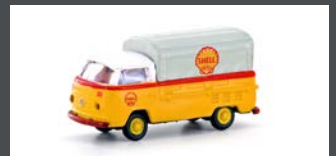
LC3954 VW T2 PRITSCHEN SHELL