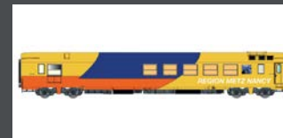
LS40155.1 MESSWAGEN SR SNCF, EP.V, BLAU/GELB/ORANGE, METZ/NANCY