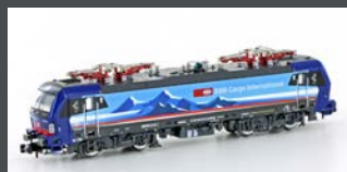
H3007 E-LOK BR 193 VECTRON SBB CARGO ALPPIERCER 2 D/A/CH/NL, EP.VI