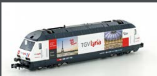
K137120 E-LOK SBB RE4/4 460 TGV LYRIA, EP. IV-V