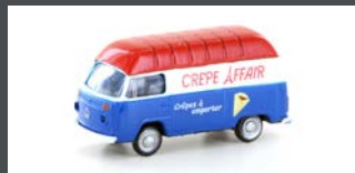
LC3952 VW T2 FOODTRUCK "CRÊPES"