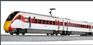
K101674 TRIEBZUG CLASS 800/2 LNER / AZUMA, 5-TLG., EP.VI