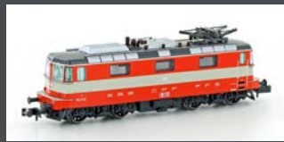
H3022 E-LOK RE 4/4 II 1.SERIE SBB, SWISS EX., EP. III-IV