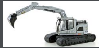
LC4264 LIEBHERR COMPACT BAGGER KETTE SILBER M. TIEFLÖFFEL