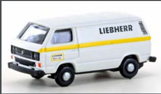
LC4341 VW T3 LIEBHERR SERVICE