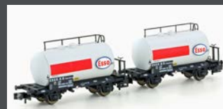
H24832 2ER SET LEICHTBAU- KESSELWAGEN DB/ESSO, EP.IV