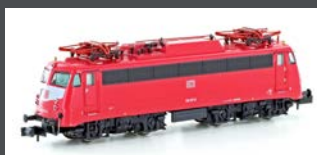
H28014 E-LOK BR 110.3 DB EP.IV-V, ORIENTROT H28014S MIT SOUND