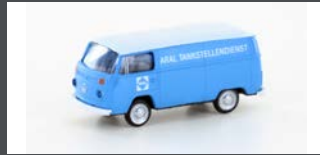
LC3922 VW T2 DOKA "ARAL TANKSTELLENDIENST"