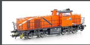
90248 DIESELLOK VOSSLÖH G1000 BB NORTHRAIL, EP.VI 90249 MIT SOUND