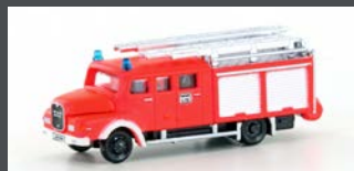
LC4221 MAN LF 16-TS FEUERWEHR, LEUCHTROT