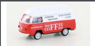
LC3950 VW T2 FOODTRUCK "COFFEE"