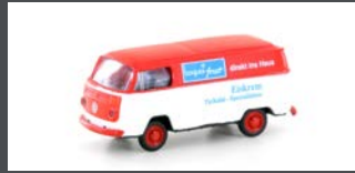
LC3917 VW T2 TRANSPORTER "BOFROST"