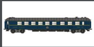
LS49198 SPEISEWAGEN WR52 CIWL, EP.IV, 1971, ITALIENISCH