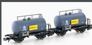
H24831 2ER SET LEICHTBAU- KESSELWAGEN DB/VTG/ SHELL, EP.IV