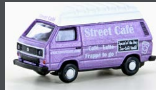
LC4346 VW T3 STREET CAFÉ (METALLIC SERIE)