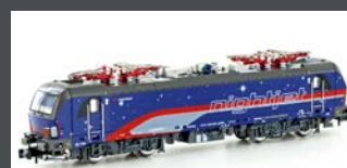
H30162 E-LOK RH 1293 200 VECTRON ÖBB NIGHTJET, EP.VI