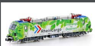
H30150 E-LOK BR 192 SMARTRON RHEINCARGO, EP.VI H30150S MIT SOUND