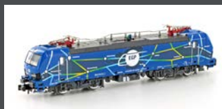
H3006 E-LOK BR 192 SMARTRON EGP, EP.VI