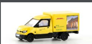
LC4556 STREETSCOOTER WORK "DHL BERLIN" 1:160