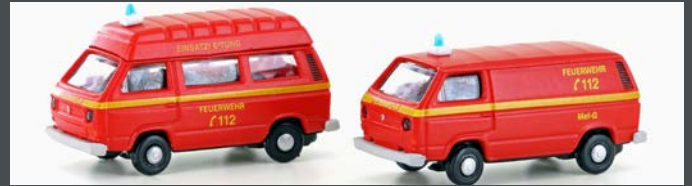
LC4342 VW T3 2ER SET FEUERWEHR