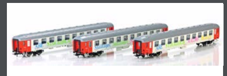
HE13060804 3ER SET LIEGEWAGEN 2.KL SNÄLLTÅG, EP.VI, STOCKH.-BERLIN AC