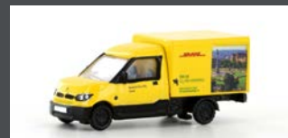
LC4554 STREETSCOOTER WORK "DHL STUTT GART" 1:160