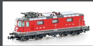
H3026 E-LOK RE 4/4 II 11133 SBB, EP.IV-V, EX. SWISS EXPRESS