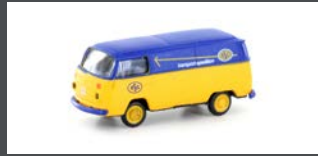
LC3918 VW T2 TRANSPORTER ASG