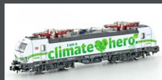
H3013 E-LOK BR 193 363 VECTRON DB "CLIMATE HERO", EP.VI