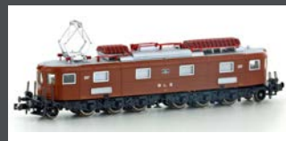
H10184 E-LOK AE 6/8 BLS 8-ACHSIG 207 BRAUN, EP.III