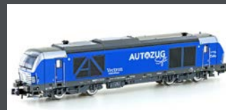
H3112 DIESELLOK BR 247 908 AUTOZUG SYLT, EP.VI