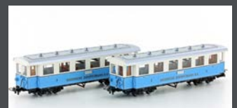
H43103 ZUGSPITZBAHN 2 WAGEN H0E / 9MM