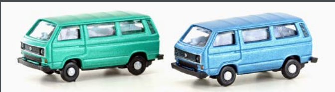
LC4347 VW T3 2ER SET (METALLIC SERIE)