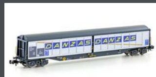
H23473 SCHIEBEWANDWAGEN HABILS SBB / DANZAS, EP.IV-V