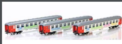
HE13060803 LIEGEWAGEN SET 3TLG. 2. KLASSE "BERLIN NIGHT EXPRESS" DC