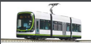
K148041 STRASSENBAHN HIRODEN 1000 LRV HER, EP.VI