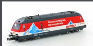
K137123 E-LOK SBB RE4/4 460 COOP PRO MONTAGNA EP.IV-V