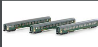
K23012 3ER SET RIC PERSONENWAGEN BM, 2.KL. SBB, EP. IV-V