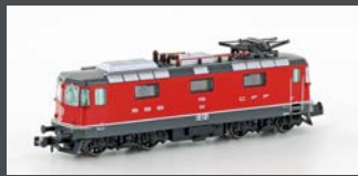
H3021 E-LOK RE 4/4 II 1.SERIE SBB, ROT, EP. III-IV