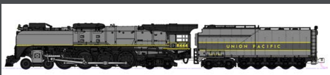
K1260403 DAMPFLOK FEF-3 UNION PACIFIC EP.2/6, GREYHOUND