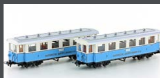
H43101 ZUGSPITZBAHN 2 WAGEN H0M / 12MM