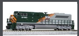
K1768410 DIESELLOK EMD SD70ACE UP/WP HERITAGE EP.6