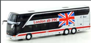
LC4462 SETRA S 431 DT DB IC BUS / LONDON