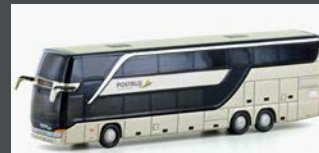
LC4487 SETRA S 431 DT POSTBUS (AT), METALLIC GOLD