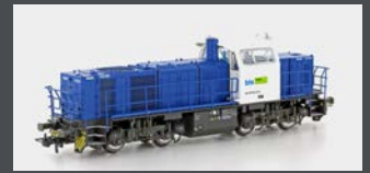
90256 DIESELLOK VOSSLÖH G1000 BLS, EP.VI DC