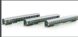
K23011 3ER SET RIC PERSONENWAGEN BM, 2.KL. SBB, EP.IV