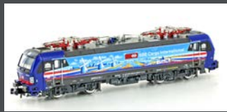
H3014 E-LOK BR 193 VECTRON SBB CARGO NL-PIERCER, EP.VI