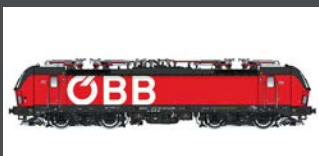
LS17911 E-LOK RH 1293 VECTRON ÖBB, EP.VI, AC LS17911S MIT SOUND