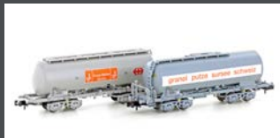
H23491 2ER SET SILOWAGEN UACS SBB GRANOL + COOP, EP.IV