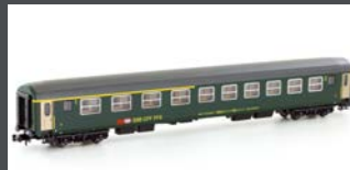
K23121 SBB RIC WAGEN NEUES LOGO 1/2. KL. ABM