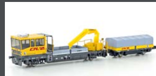
H23565 GLEISKRAFTWAGEN ROBEL SERIE 700 CFL, EP.V-VI, MOTORISIERT