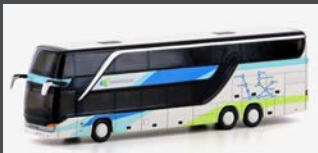
LC4485 SETRA S 431 DT WESTBUS (AT)