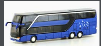
LC4488 SETRA S 431DT REISEBUS NEUTRAL, METALLIC BLAU