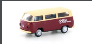
LC3926 VW T2 BUS "TEE"