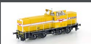
HE10021571 DIESELLOK MAK 650D WIEBE EP.IV DC ANALOG