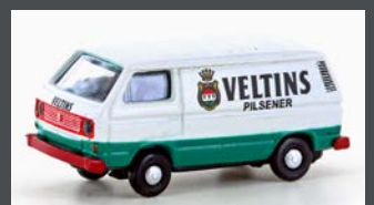
LC4358 VW T3 VELTINS