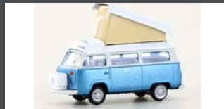
LC3929 VW T2 CAMPER TÜRKIS/ WEISS (METALLIC SERIE)