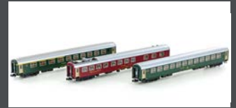
K23013 3ER SET RIC PERSONENWAGEN ABM+BM+WRTM SBB, EP. IV-V