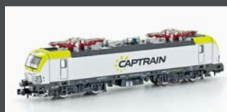
H2978 E-LOK BR 193 VECTRON CAPTRAIN, EP.VI