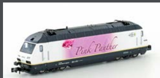
K137122 E-LOK BLS RE465 PINK PANTHER EP.IV-V