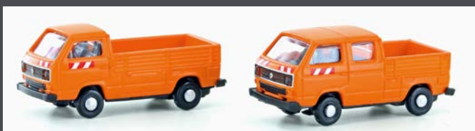
LC4356 VW T3 2ER SET KOMMUNAL FAHRZEUGE