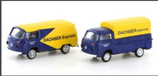
LC3921 VW T2 SET "DACHSER SPEDITION"