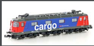
K10175 E-LOK RE 620 SBB CARGO, EP.V-VI, MIT KLIMAAANLAGE