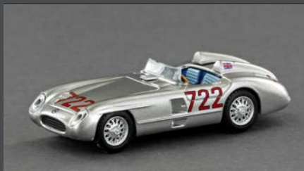
LE87302 MB 300 SLR ROADSTER #722, 2 KOPFSTÜTZEN. FAHRER: STIRLING MOSS UND DENIS JENKINSON, SIEGER MILLE MIGLIA 1956, 1:87