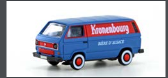
LC4327 VW T3 KASTEN KRONENBOURG