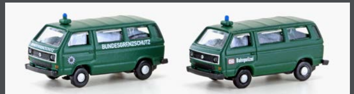
LC4353 VW T3 2ER SET BGS / BAHNPOLIZEI