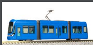
K14805-1 MODERNER STRASSENBAHN-GELENK- TRIEBWAGEN, EP.V-VI, BLAU