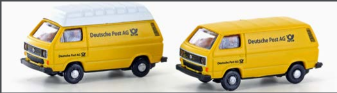
LC4343 VW T3 2ER SET DEUTSCHE POST AG