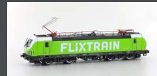
LS16074 E-LOK BR193 VECTRON FLIXTRAIN D-POOL, EP.VI