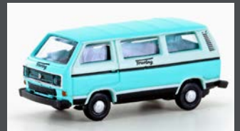
LC4348 VW T3 BUS DEUTSCHE TOURING