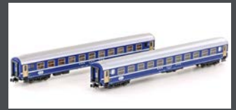
K23009 2ER SET RIC LIEGEWAGEN BCM SBB, EP.IV