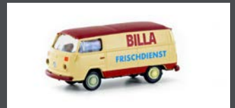
LC3945 VW T2 TRANSPORTER BILLA