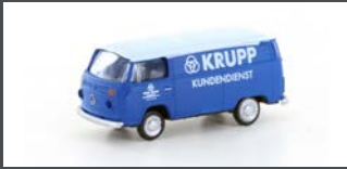
LC3897 VW T2 TRANSPORTER KRUPP KUNDENDIENST