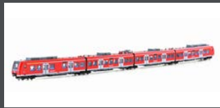
K101716 TRIEBZUG ET 425, 4-TLG. DB REGIO, EP.V-VI, NEU- TRAL