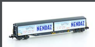
H23462 SBB HABILS "NENDAZ WASSER" GÜTERWAGEN, EP.V