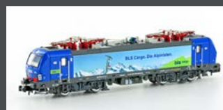
H2998 E-LOK BR 193 VECTRON HUPAC BLS, EP.VI