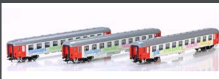
HE13060801 LIEGEWAGEN SET 3TLG. 2. KLASSE "BERLIN NIGHT EXPRESS" DC