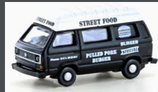
LC4349 VW T3 STREET FOOD