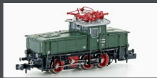
H3051 E-LOK E63 DB, EP.III, GRÜN/SCHWARZ/ROT