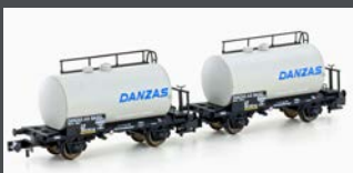
H24834 2ER SET LEICHTBAU- KESSELWAGEN DB/DANZAS, EP.IV