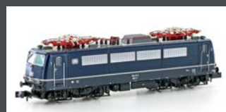
H2884 E-LOK BR 184 111-3 DB, EP.IV, STAHLBLAU