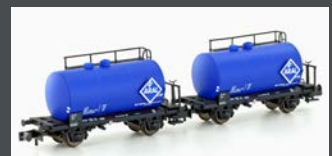
H24833 2ER SET LEICHTBAU- KESSELWAGEN DB/ARAL, EP.IV