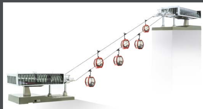
JC82497 D-LINE SET WEISS/GRAU, 1 X TALSTATION MIT BELEUCHTUNG UND ANTRIEB 1 X BERGSTATION MIT BELEUCHTUNG 6 X OMEGA V10 „ROT“ 1 X STRECKENKABEL 3 M 1 X SEIL 10 M