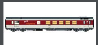
LS40153 SPEISEWAGEN VRU "GRIL EXPRESS" SNCF, EP.IV-V, ROT/GRAU