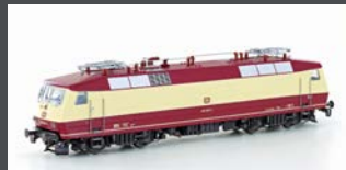
LS16082 E-LOK BR 120 005-4 DB EP.IV ROT/BEIGE DB LOGO VORSERIE