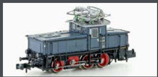
H3050 E-LOK E63 DRG, EP.II, GRAU/BLAU