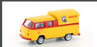
LC3953 VW T2 DOKA "BOSCH"