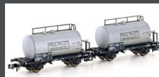
H24852 2ER SET LEICHTBAU- KESSELWAGEN SNCF/MILLET, EP.III