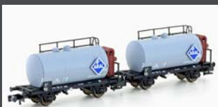
H24802 2ER SET LEICHTBAU- KESSELWAGEN DB/ARAL, EP.III