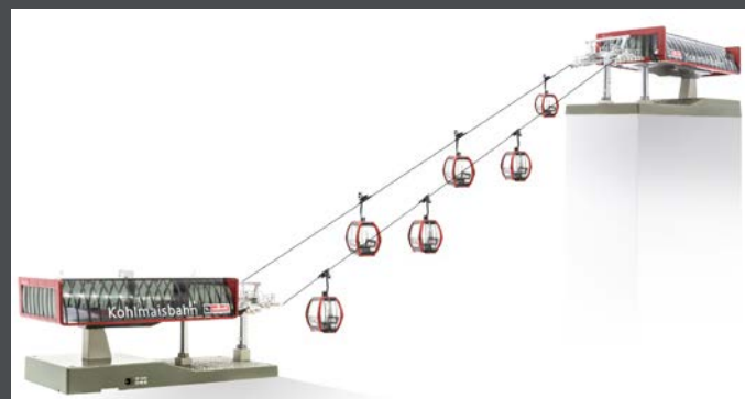
JC82498 D-LINE SET KOHLMAISBAHN, 1 X TALSTATION MIT BELEUCHTUNG UND ANTRIEB 1 X BERGSTATION MIT BELEUCHTUNG 6 X OMEGA V10 „KOHLMAISBAHN“ 1 X STRECKENKABEL 3 M 1 X SEIL 10 M