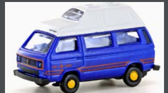
LC4350 VW T3 WESTFALIA CAMPER (METALLIC SERIE)