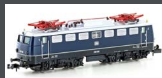
H28111 E-LOK E10.1 DB, EP.III, BLAU / SCHWARZ