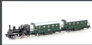
K105003 DAMPFLOK SET 3TLG. VORBILD ÖBB BR 88 SCHWARZ/GRÜN