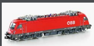
H2734 E-LOK RH 1216 TAURUS ÖBB, EP.VI