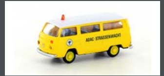
LC3924 VW T2 BUS "ADAC"