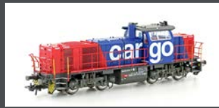
90240 DIESELLOK VOSSLÖH AM 842 SBB CARGO, EP.VI