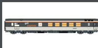
LS40148 SPEISEWAGEN "GRIL EXPRESS" SNCF, EP.IV-V, CORAIL, GRAU/WEISS