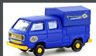
LC4357 VW T3 DOKA ASG