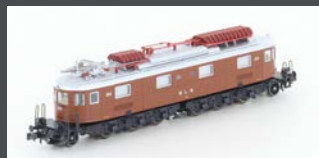
H10183 E-LOK AE 6/8 BLS 8-ACHSIG 203 BRAUN, KURZES FH, EP.IV