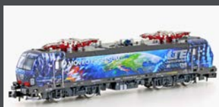
H30161 E-LOK BR 193 VECTRON LTE, EP.VII H30161S MIT SOUND