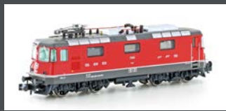
H3028 E-LOK RE 4/4 II 11140 SBB, EP.VI, EINHOLMSTROM-ABNEHMER