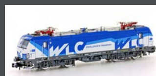
H30155 E-LOK RH 1193 VECT- RON WLC, EP.VI H30155S MIT SOUND